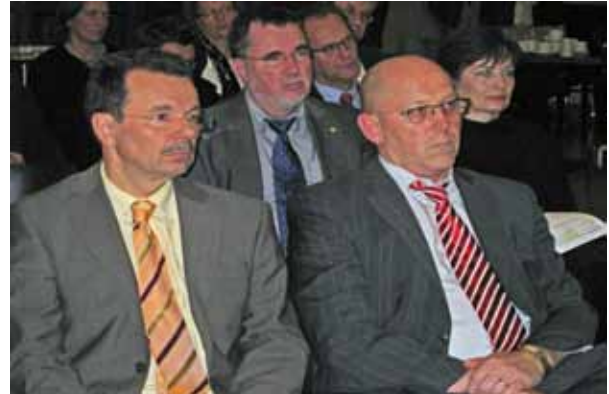
Aufmerksam hörten die Zuschauer zu.